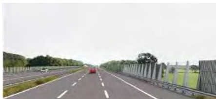
Verbreding A1: geluidsschermen Bathmen

In een goed samenspel tussen gemeenten, regio, provincies en rijk zijn mooie resultaten bereikt. Er wordt niet alleen asfalt gelegd, maar ook voorzieningen getroffen en aanpalende maatregelen gerealiseerd die zonder deze gezamenlijke inzet niet opgenomen waren. De eerste fase is succesvol uitgevoerd: snel en met goede voorzieningen bij afrit 23 Deventer, geluidvoorzieningen bij Bathmen, ecoducten. Ook in 2022 blijft deze regionale betrokkenheid nodig [tweede fase: Apeldoorn - Twello]. Vanuit het regionale belang voor de verbreding van het resterende deel naar het westen: het tracé tussen Barneveld en Apeldoorn, neemt de regio deel in het project A1/A30